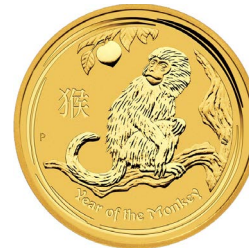
2016 Lunar „Affe“