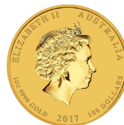
2008 – xxxx Gemeinsame Rückseiten