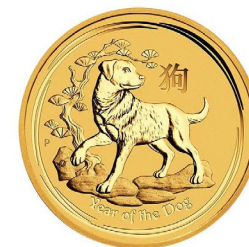
2018 Lunar „Hund“