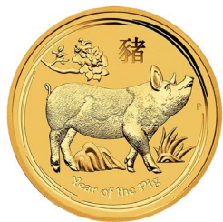
2019 Lunar „Schwein“