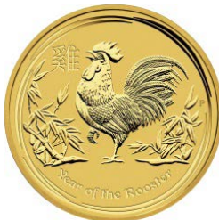
2017 Lunar „Hahn“