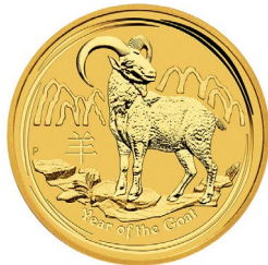
2015 Lunar „Ziege“